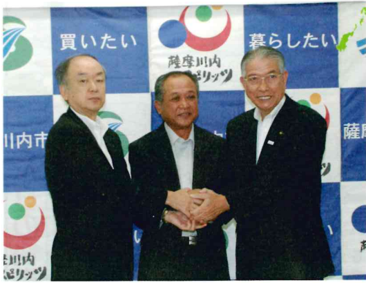
▲吉野木材(有)吉野代表取締役(写真中央)