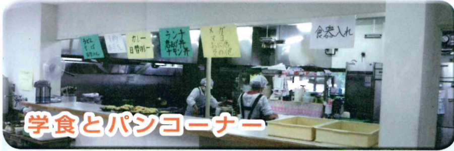
学食とパンコーナー